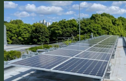
太陽光パネル設置