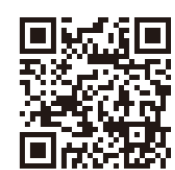
北海道型ワーケーションポータルサイト