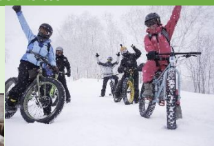
「ふるさとサポート活動」イメージ