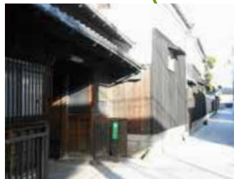
上柏茶問屋街“茶問屋ストリート”(木津川市)