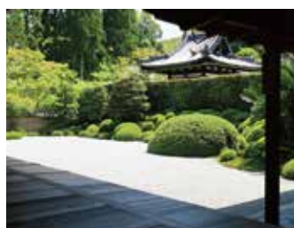
酬恩庵一休寺(京田辺市)

京都・山城地域とは、京都府の南部に位置し、宇治市・八幡市・城陽市・京田辺市・木津川市・久御山町・宇治田原町・井手町・精華町・和束町・笠置町・南山城村の12市町村を指します。