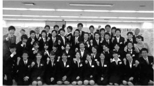
23 年度の研修生とスタッフ

この事業は、30 歳未満で正規雇用されていない区内の若者を対象に、ビジネスマナーやビジネススキル、基礎的な O A 等の研修を