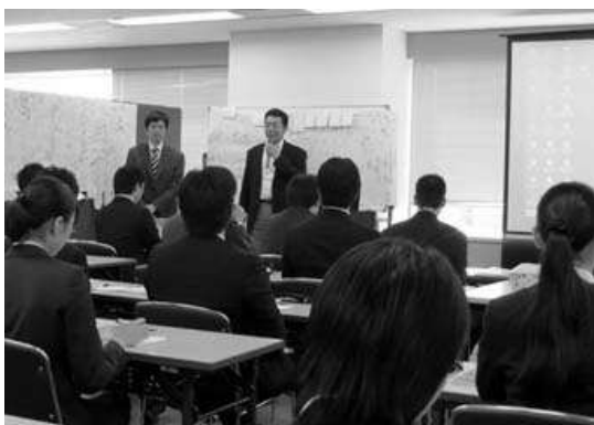
企業プレゼン、昨年就職した研修生がプレゼンターとして参加

現在、98 企業から 204 件の求人を得て、40 名の研修生が順次各企業で就労実習に就いています。