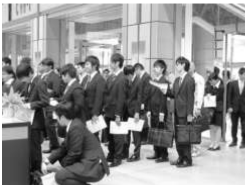
写真上：企業経営者の説明を聞く高校生たち

「ヤングジョブクリエイションおおた」は、ハローワーク大森・東京しごと財団との共催事業です。地域の教育機関とも連携し、若者と中小企業との出会いの場を地域全体で作り出しています。このほか、企業 10 社、求職者 50 人程度の小規模面談会である「 プレ就職面談会 」も年 1 回開催しています。(平成 24 年度は 12 月 12 日に実施予定)