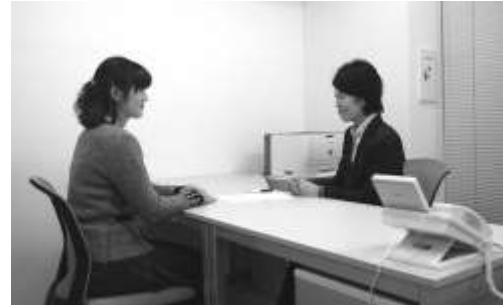
若者就労支援コーナー 相談風景

杉並区と東京労働局及びハローワーク新宿が雇用、産業施策等を一体的に実施するための協定を締結し、平成24年12月3日に杉並区就労支援センターが開設されました。国が運営するハローワークと、区就労支援窓口が同じフロアに設置されることで、就労準備相談と職業相談・