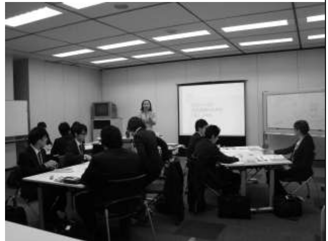
昨年度就活関連事業（ジョブサポート）の研修風景

厚生労働省の平成 24 年 10 月時点の調査結果では、来春卒業予定の大学生等の就職内定率は、63.1%と依然厳しい状況が続いております。就職先としては中小企業の注目度が高くなってきていますが、その魅力をさらに積極的に伝えていくことが重要とされています。