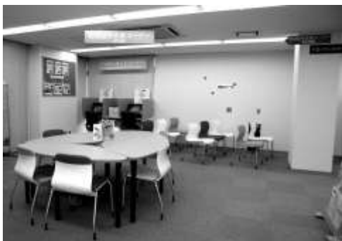
杉並区就労支援センター室内

区内企業を中心に魅力ある企業を紹介する企業PRコーナーや、インターネット接続パソコン（2台）を使って就職情報が検索できるコーナー、就職関連の書籍やチラシが閲覧できるコーナーもあります。就職に関する各種セミナーの開催、グループワークやジョブスクール等、あらゆる角度から若者を支援しています。