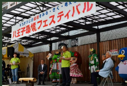
環境フェスティバルの開催