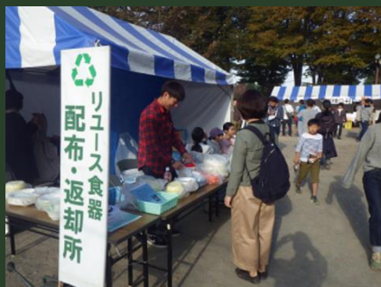
リユース食器使用推進