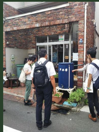
見学会 （雨水利用、浸水被害対策）