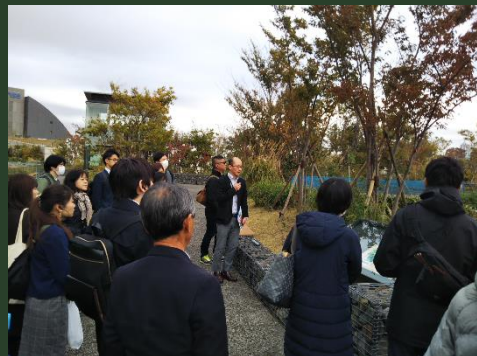
見学会（グリーンインフラ）