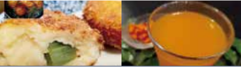
しゃきしゃき♪ ラワンぶきがある自家製さつま揚げ 使用食材: ラワンぶき水煮

住所: 墨田区太平 3-8-9 TEL: 03-3624-1477 営業時間: 昼の部 11:30~14:00(入店) 夜の部 16:30~18:00(入店) お持ち帰り 昼の部 11:00~L.O.14:00 夜の部 17:00~L.O.21:30 定休日: 不定休 ジャンル: 和食