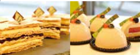
ハスカップとキタノカオリのミルフィーユ 使用食材: ハスカップ・小麦粉(きたのかおり)・牛乳・生クリーム

住所: 墨田区緑 2-14-14 TEL: 03-3631-6630 営業時間: 10:00~20:00 定休日: 木曜日 ジャンル: 洋菓子