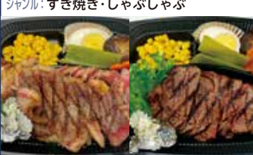
テイクアウトのみにて販売 和牛リブロースステーキ(北海道産別産) 和牛ヒレステーキ(北海道産別産)

住所: 墨田区八広 3-7-1 TEL: 03-5631-2539 営業時間: 昼 11:30~14:00 ※緊急事態宣言に伴い営業時間、定休日を変更させていただいております。詳しくはTELでご確認をお願いいたします。 ジャンル: すき焼き・しゃぶしゃぶ