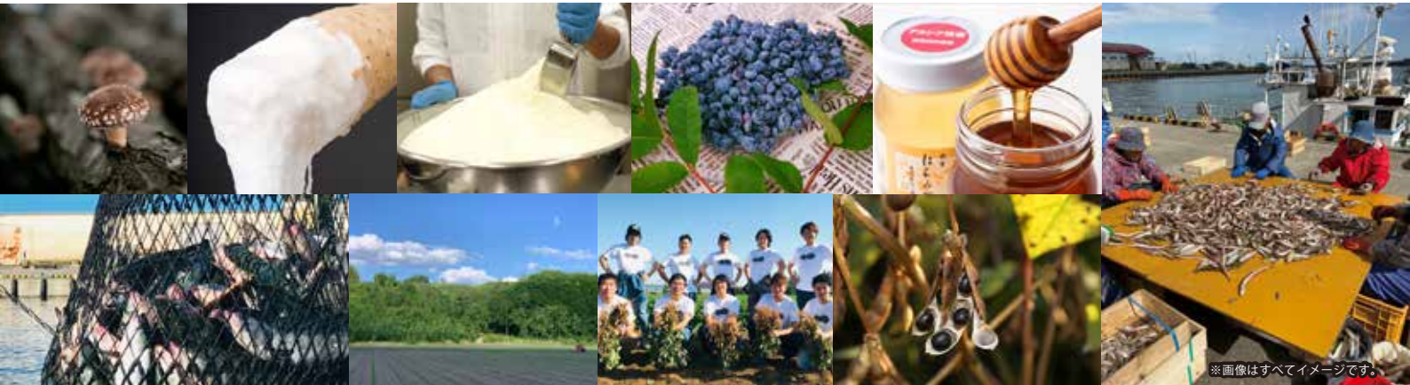
※画像はすべてイメージです。

北海道十勝地域(16町2村)の 選りすぐりの特産品や旬の食材が 台東区 & 墨田区で買える!!