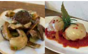
原木しいたけのトリフォラーティ 使用食材: 原木しいたけ

住所: 墨田区東向島 2-29-1 TEL: 03-6657-1668 営業時間: 月~土 10:00~19:30 (L.O. 19:00) 日曜日 11:00~17:00 (L.O. 16:30) 定休日: 第一・第三月曜日、祝日 ジャンル: 和食・洋食