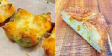
枝豆チーズ 使用食材: 枝豆・ゴーダチーズ・小麦粉

住所: 墨田区向島 3-39-8 TEL: 03-3625-2201 営業時間: 水・木・金 8:00~18:30 土・日・祭 7:30~18:00 定休日: 月曜日、火曜日 ジャンル: パン