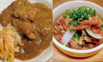
うらほろ和牛のビーフカレー 使用食材: 牛肉(うらほろ和牛)

住所: 墨田区東向島 6-2-3 TEL: 03-6886-5434 営業時間: ランチ 11:00~14:00 夜 16:00~20:00 定休日: 水曜日 ジャンル: 弁当、総菜販売