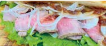
十勝和牛のローストビーフコッペパン 使用食材: うらほろ和牛

住所: 墨田区立花 2-1-11 TEL: 03-3619-2223 営業時間: 月・水・木・金 7:00~18:30 土・日・祭 7:00~18:00 定休日: 火曜日 ジャンル: パン