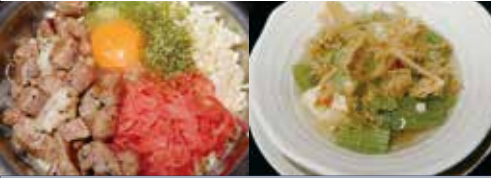
新町エゾシカ × 東京小麦粉 エゾシカ肉たっぷりお好み焼 使用食材: エゾシカ肉

住所: 墨田区業平 5-10-2 TEL: 03-3829-6468 営業時間: 月~土 17:00~24:00(22:30入店終了) 日・祭 11:30~14:00(ランチあり) 定休日: 不定休 ジャンル: 居酒屋・もんじゃ焼