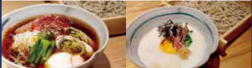
十勝産ナイタイ和牛と温玉のつけ蕎麦 使用食材: ナイタイ和牛・たまご

住所: 墨田区向島 5-27-10 Sビル TEL: 03-6658-8462 営業時間: 昼 11:30~14:00 / 夜 17:00~23:00 定休日: なし ジャンル: そば、和食(その他)、懐石・会席料理