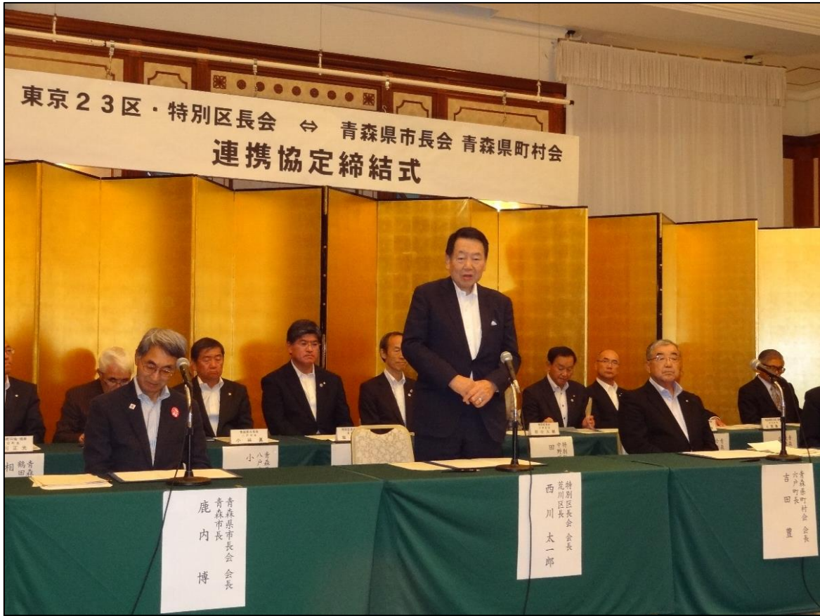
【 西川会長あいさつ 】