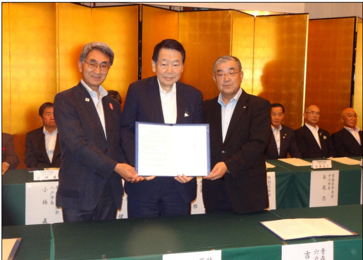
【 （左から）鹿内会長、西川会長、吉田会長 】