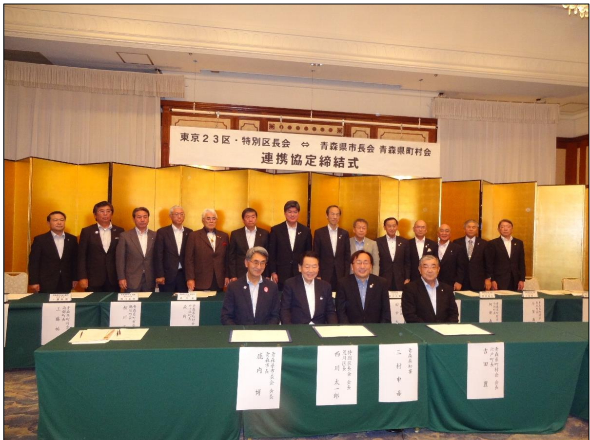
【 連携協定締結式 出席者 】