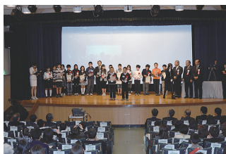
フィナーレ・イベント (表彰式)

都内の 58 小学校、2,695 名の児童が参加して、平成 21 年 11 月から 12 月に家庭で環境負荷低減活動に取り組みました。